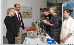
Impressionen von 2012