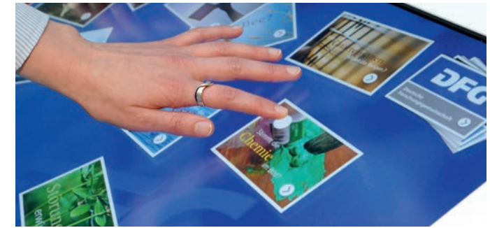
Bild oben: Ein Multimedia-Tisch gibt einen Einblick in die Ausstellung und die Arbeit der Deutschen Forschungsgemeinschaft.