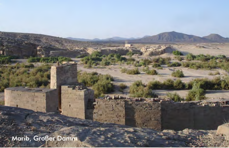
Marib, Großer Damm