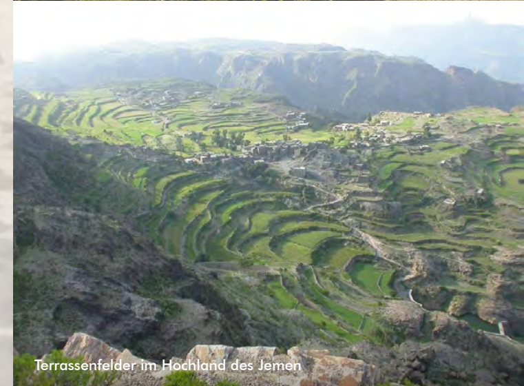
Terrassenfelder im Hochland des Jemen