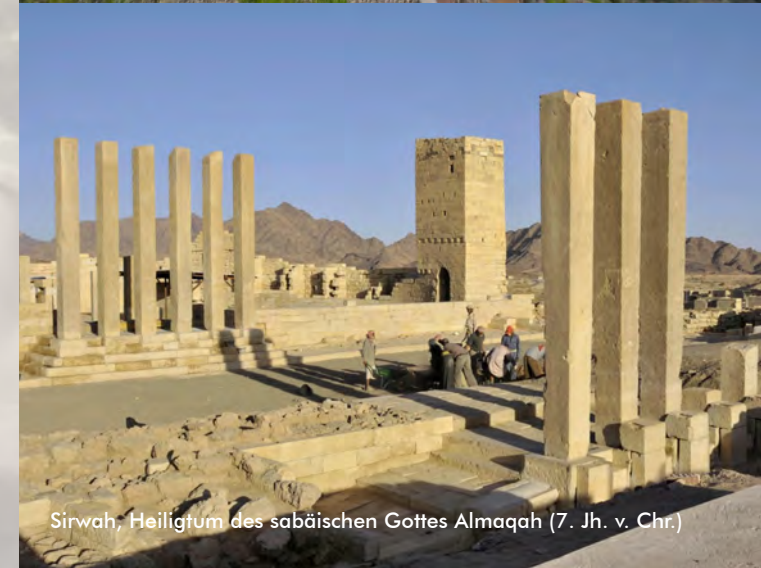
Sirwah, Heiligtum des sabäischen Gottes Almaqah (7. Jh. v. Chr.)