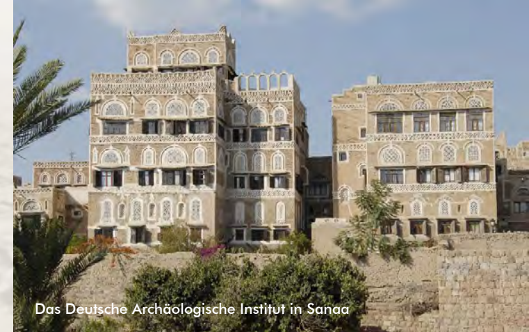
Das Deutsche Archäologische Institut in Sanaa