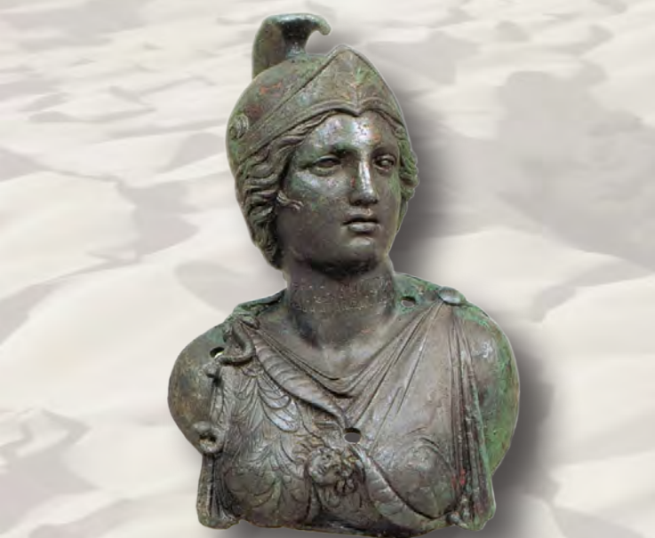
Jabal al-'Awd, Athena-Büste