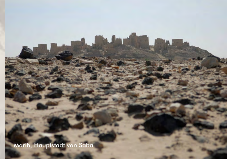
Marib, Hauptstadt von Saba