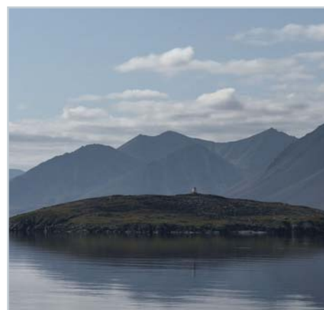
Bild: Landschaft bei Yanrakynnot, Ulrike Ottinger

Die Veranstaltung findet im Rahmen der 3. Internationalen Chamissokonferenz „Weltreisen: Aufzeichnen, aufheben, weitergeben – Forster, Humboldt, Chamisso“ statt. Weitere Informationen zur Konferenz finden Sie unter: humboldt.staatsbibliothek-berlin.de