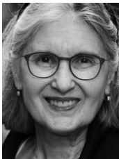
Prof. Dr. Lorraine Daston

Diesen Fragen widmen sich namhafte Expertinnen und Experten beim 66. ZEIT FORUM WISSENSCHAFT der Wochenzeitung DIE ZEIT, der ZEIT-Stiftung Ebelin und Gerd Bucerius sowie des Deutschlandfunks und der Berlin-Brandenburgischen Akademie der Wissenschaften.