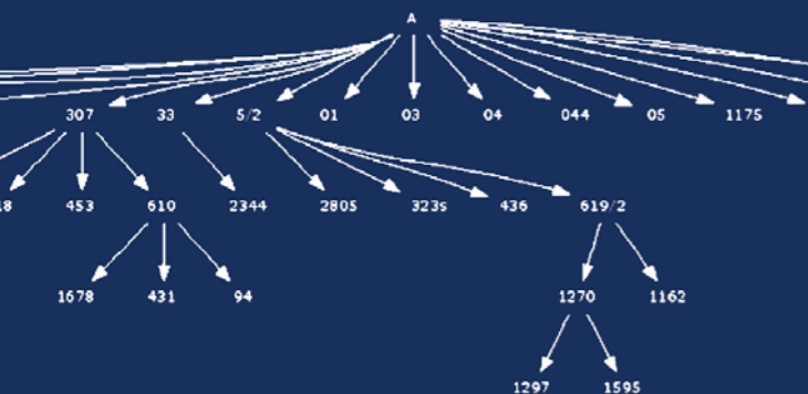
Ausschnitt Textflussdiagramm für Apg 1,2/10-22a

In dem gezeigten Textflussdiagramm steht jede Zahl für eine Handschrift; „A“ bezeichnet den vermuteten „Ausgangstext“ (die älteste erreichbare Textgestalt).