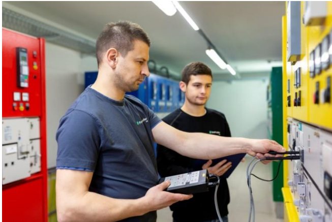
Inbetriebnahme der Mittelspannungsschaltanlage im Untergeschoss des Zentrums.