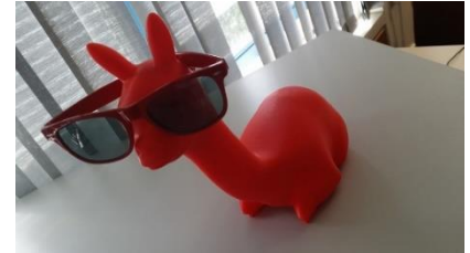
Entspanntes Maskottchen: Im „LAMA“ setzen Studierende des KIT mit KI-Methoden eigene Praxisprojekte erfolgreich um.

http://www.sek.kit.edu/wissenschaftsjahr2019.php