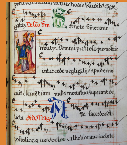
Staatliche Bibliothek Regensburg, 2° Liturg. 1 Antiphonar aus St. Emmeram, 16. Jh.