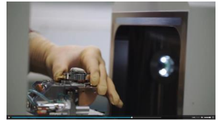
Video „Von Käfern Lernen: Oberflächen nach dem Vorbild der Natur“:

„Wir umgehen die Verwendung von umwelt- und gesundheitsschädlichen Pigmenten, indem wir poröse Polymerstrukturen mit vergleichbar hoher Streuung erzeugen“, so Hölscher. Inspiriert wurden er und sein Team von dem weißen Käfer Cyphochilus insulanus , dessen Schuppen dank einer speziellen Nanostruktur seines Chitinpanzers weiß erscheinen. „Nach diesem Vorbild stellen wir aus Polymeren feste, poröse Nanostrukturen her, die einem Schwamm ähneln“, sagt Hölscher, der am IMT die Forschungsgruppe Biomimetische Oberflächen leitet. Wie die Bläschen von Rasier- oder Badeschaum sorgt auch hier die Struktur für eine Streuung des Lichts, die das Material weiß wirken lässt. Die neue Technik für eine kostengünstige und unbedenkliche weiße Optik eignet sich für verschiedenste Oberflächen.