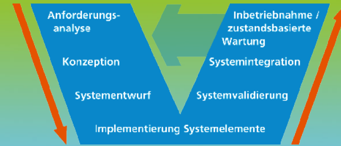
V-Modell zur Zuverlässigkeitsbewertung