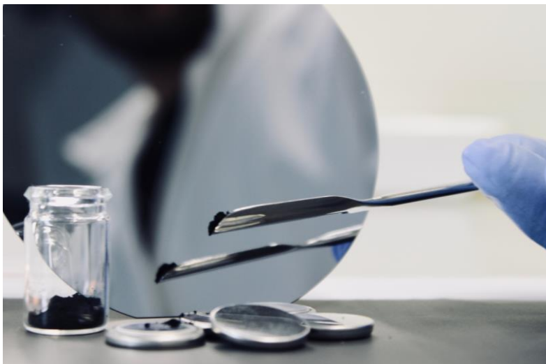
Mit neuen Materialien will das Forscherteam sichere und langlebige Hochleistungszellen ermöglichen.

Lithium-Lanthan-Titanat-Partikel ermöglichen selbst in Mikrometergröße hohe Leistungsdichten – Publikation in Nature Communications