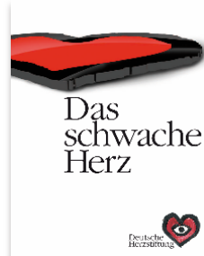
Cover: DHS/Jan Neuffer; Collage: Stefanie Schaffer; Foto: DHS

Kontakt: Pressestelle, Deutsche Herzstiftung, Michael Wichert (Ltg.), Tel. 069 955128114 / Pierre König, Tel. 069 955128140, E-Mail: presse@herzstiftung.de , www.herzstiftung.de