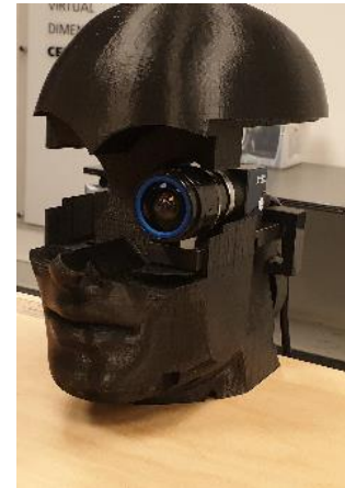
Abbildung 1: Messaufbau: 3D-gedruckter Kopf plus Hochfrequenz-Kamera

VR-Headsets, oder auch Head-Mounted Displays (HMDs), sind wichtige Komponenten von Virtual-Reality(VR)-Installationen. Mit geringem Geld- und Platzbedarf lässt sich ein sehr hohes Gefühl der Virtuellen Präsenz erzeugen. Aber nur, wenn der Änderung der Benutzerblickrichtung unmittelbar die Änderung der graphischen Anzeige folgt, wird die so genannte Cyber Sickness vermieden. Cyber Sickness ähnelt der Seekrankheit, die vor allem dann auftaucht, wenn der Orientierungssinn (Vestibularorgan) und der Sehsinn verschiedene Informationen über den Bewegungszustand an das Gehirn melden. Unwohlsein bis hin zur Übelkeit und Gleichgewichtsstörungen können die Folgen sein. Verschiedene Faktoren spielen bei der Darstellungsgeschwindigkeit eine Rolle. Dazu zählen natürlich Softwaresysteme (eine leistungs- und vor allem echtzeitfähige Render Engine) oder schnelle Graphikkarten. Letztere wurden mittlerweile um etliche Mechanismen erweitert, welche die Render-Pipeline in Teilbereichen abkürzen, um eine schnellere Reaktionsantwort des Renderings auf Nutzerbewegungen zu ermöglichen. Ein weiterer Faktor ist die Frequenz, mit der das Display des HMDs angesteuert wird. Je höher die Frequenz, desto schneller kann das Display reagieren.