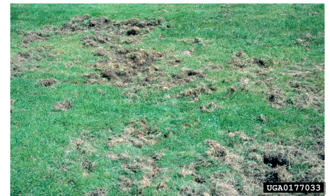
4. Schaden an einer Wiese durch die Larven des Japankäfers

Zierpflanzen: Calluna vulgaris (Heide), Dahlia sp., Aster sp., Zinnia sp. u.a. sowie die Ziergehölze Thuja sp., Syringa sp. (Flieder), Virburnum sp. (Schneeball) u.a.