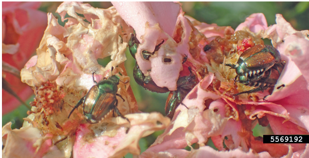
7. Fraßschäden an Rosenblüten

Wie kann das Einschleppen und Verbreiten verhindert werden?