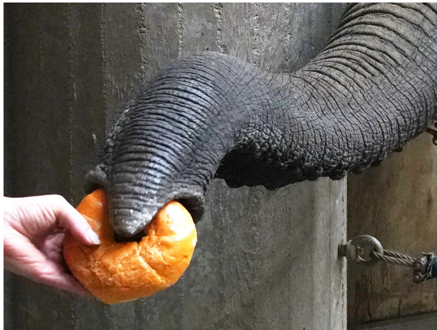
Ein Afrikanischer Elefant greift ein Brötchen. Neue Daten zeigen den außerordentlichen Tastsinn des Elefantenrüssels.

Elefanten haben einen stark spezialisierten Tastsinn. Das bestätigte eine Forschungsarbeit, die die Sensorik von Elefanten untersuchte und die am 20. Januar 2022 in Current Biology erscheint