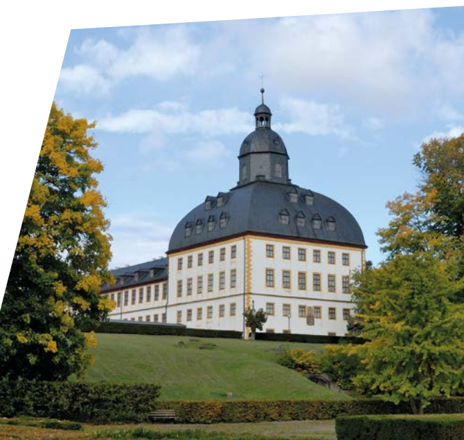
Bibliotheksturm mit Garten