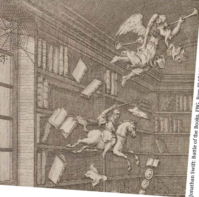
Jonathan Swift: Battle of the Books. FBG, Poes 8° 1744/3 (2), S. 56.

Dienstag, 10. Mai | 19 Uhr Präsentation und Diskussion: Neues Büchermagazin für die Forschungs- bibliothek Gotha. Mehr als Funktionserfüllung. Eine architektonische Recherche.