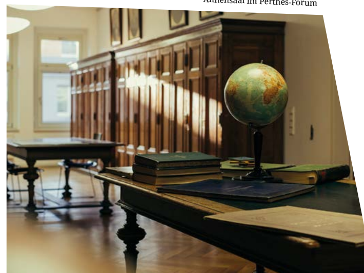
Ahnensaal im Perthes-Forum

Zum 200. Geburtstag von August Petermann bietet die Sammlung Perthes der Forschungsbibliothek Gotha Sonderführungen durch ihre kartografischen Bestände an. Weitere Informationen zur Veranstaltung entnehmen Sie bitte der Homepage der Bibliothek.