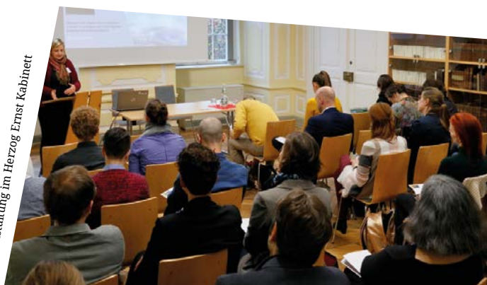
Veranstaltung im Herzog Ernst Kabinett