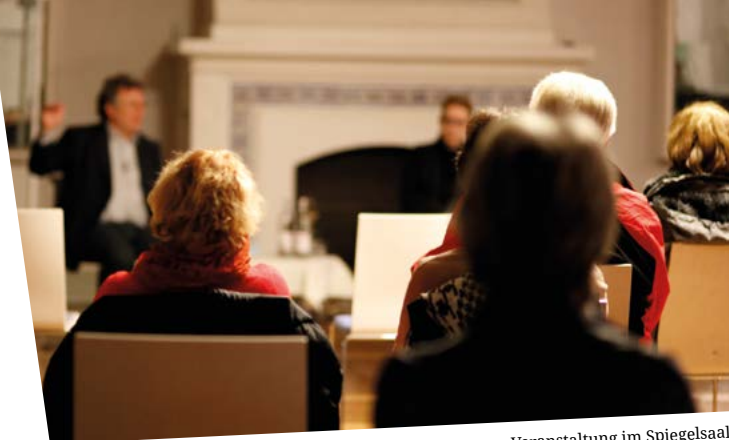
Veranstaltung im Spiegelsaal

Ausführliche Informationen zu den einzelnen Veranstaltungen der Gesprächsreihe erhalten Sie auf der Homepage der Bibliothek.