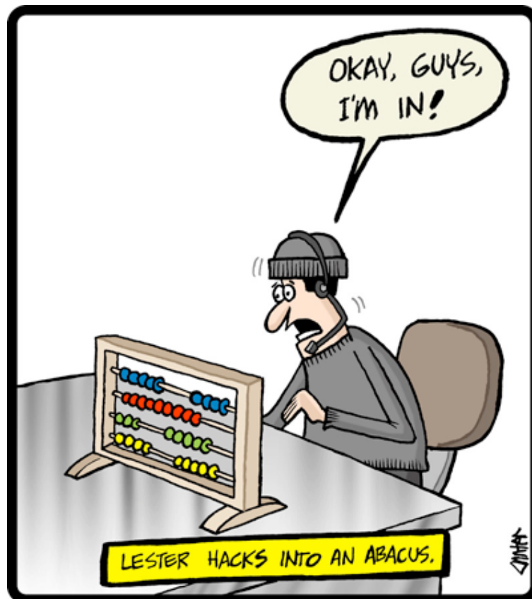
“Abacus Hacker” von Jon Carter, USA 2012

Alle eingereichten Cartoons werden von einer Jury beurteilt (kompetente Personen aus den Bereichen Mathematik, Medien und Kunst), um drei besonders herausragende Werke mit dem DMV Mathematik-Cartoon-Preis 2022 zu ehren. Die Preisverleihung erfolgt im September 2002 im Rahmen des DMV-Jahrestreffens in Berlin.