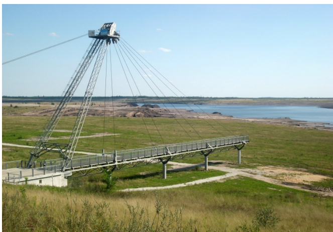
Aufgehender Ilse-See an den IBA-Terrassen Großräschen/Lausitz