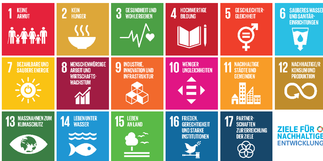
Abbildung 2: Die 17 Ziele für Nachhaltige Entwicklung (SDGs) der Vereinten Nationen

Stand: 1. Dezember 2022, die Farbkodierung orientiert sich an den Dimensionen, die ein SDG primär adressiert. Dabei ist Rot: Sozial , Grün: Ökologisch , Blau: Ökonomisch und Violett: Gemischt . Insgesamt wurden 57 Nachhaltigkeitserklärungen untersucht.