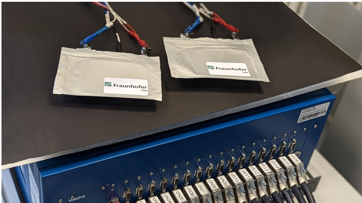
Neuentwickelte Prototypen der Aluminium-Ionen-Pouchzelle für den Einsatz im INNOBATT-Demonstratorsystem.

Unter der Prämisse „Eine Batterie neu denken“ verfolgt das Verbundvorhaben INNOBATT einen innovativen Ansatz für anwendungsspezifische Batteriespeicher, der möglichst viele Stufen der Technologieentwicklung einbezieht. INNOBATT wurde Ende 2022 gestartet und vereint ein Konsortium aus Wissenschaft und Industrie. Ziel der Projektpartner ist die gemeinsame Entwicklung eines intelligenten elektrischen Speichersystems inklusive der kompletten Neugestaltung der dafür benötigten Konstruktionselemente.