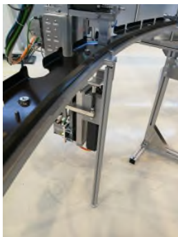
Abbildung 3 | Bildunterschrift

Flugzeugruppf der Zukunft: Der Clean Sky 2 Multifunctional Fuselage Demonstrator (MFFD) im Detail. Er wird aktuell von Fraunhofer im Forschungszentrum CFK NORD in Stade im 1:1 Maßstab mit Projektpartnern realisiert.