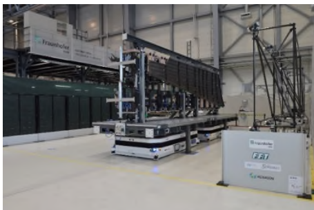
Abbildung 5 | Bildunterschrift

Automatisierte Rudergabelmontage in Flugzeugseitenleitwerken – Automatisierter bedarfsgerechter Shimauftrag zum Ausgleich von Bauteiltoleranzen: ein Leichtbauroboter führt eine Rudergabel zur Shimapplikation unter die Dosieranlage.