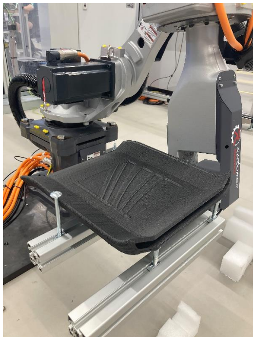
Abb. 3 Standardmaschinen vernetzen und Bauteile flexibel herstellen: Anwendungsbeispiel Sitzschale