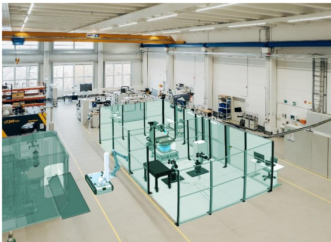
Abb. 1 Matrix-Architektur am IWU-Standort Dresden (Pforzheimer Straße): flexibel beplanbare Fertigungszellen. Das Versuchsfeld ist real aufgebaut; der digitale Zwilling ermöglicht Variantenuntersuchungen und -optimierungen (hier visualisiert im Rendering)

SWAP und Matrixproduktion sind damit letztlich vom Menschen her gedacht: Dort, wo menschliche Kreativität und Flexibilität unersetzlich sind, müssen die Voraussetzungen dafür geschaffen werden, dass der Mensch in komplexen Produktionssystemen seine Stärken noch besser ausspielen kann. Monotone und körperlich belastende Tätigkeiten, für die nicht mehr genügend Fachkräfte zur Verfügung stehen, müssen künftig automatisiert werden. Das Fraunhofer IWU forscht an unterstützenden Prozessen und IT-Lösungen, die dafür erforderlich sind.