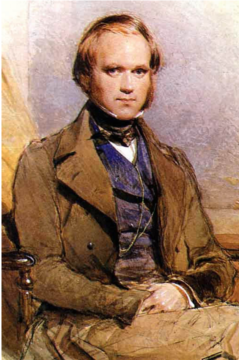
Der junge Charles Darwin